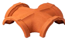
QUATTRO VIE PER COLMO / 4 WAYS CROSS RIDGE