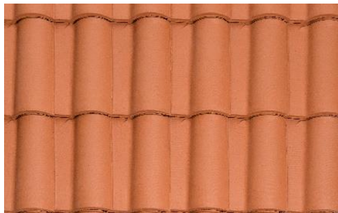
DARK SHADE (VAL) (solo export/only export)