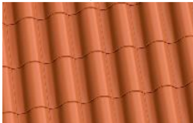
ROSSO RAME (VAL) (solo export/only export)