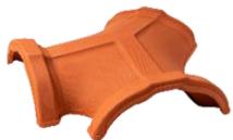
TRE VIE PER COLMO / 3 WAYS CROSS RIDGE