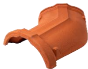
DUE VIE PER COLMO / 2 WAY CROSS RIDGE