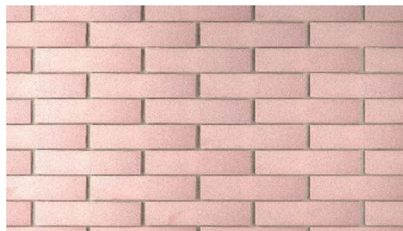
ROSATO SABBATO LISCIO