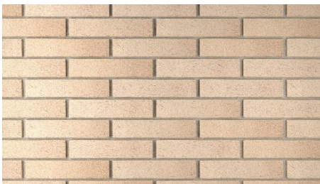
GIALLO SABBATO LISCIO