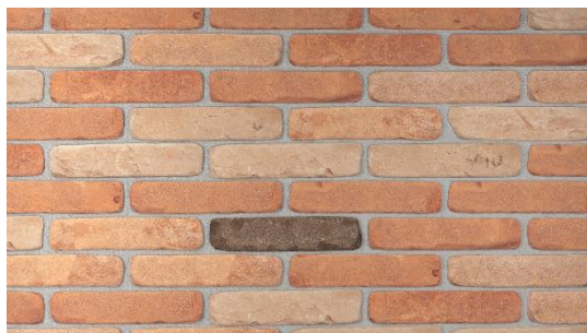
ANTICHE MURA (MISCELATI BURATTATI)

N.B. per i dati tecnici e prestazionali si vedano le DOP scaricabili dal sito www.pica.it