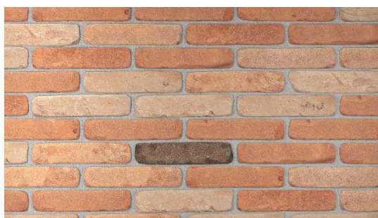
ANTICHE MURA (MISCELATI BURATTATI)

N.B. per i dati tecnici e prestazionali si vedano le DOP scaricabili dal sito www.pica.it